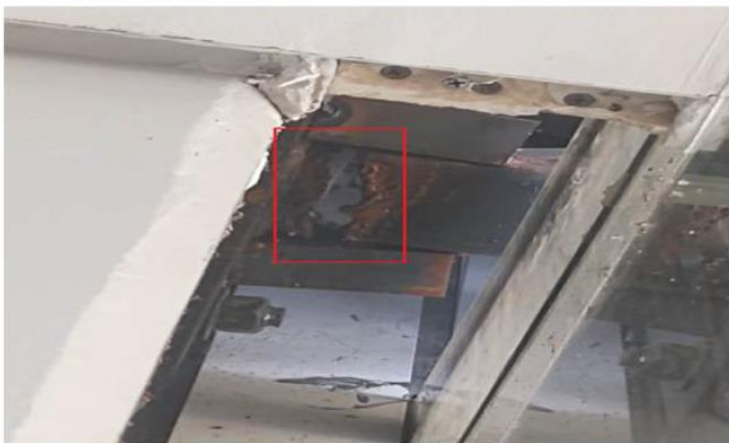
Viga metálica rompida.

3.2. Por conseguinte, solicitamos a abertura de processo licitatório para a CONTRATAÇÃO DE EMPRESA PARA REFORMA DE ESTRUTURA DE MARQUISE NO CENTRO DIAGNÓSTICO MARIA MARIANO MENEGHIN – JD.